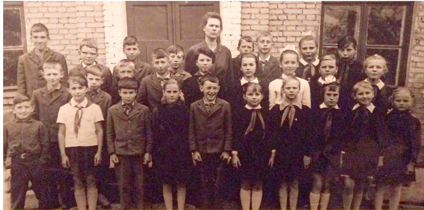
Московская область, Ленинский район, посёлок Ново-Пределкино. Пределкинская средняя школа (приблизительно 1968 год).

Район Ново-Пределкино уже тридцать лет устремлён ввысь своими многоэтажными домами. До их постройки на этой земле располагался одноимённый посёлок. И самым высоким в нём был дом (только не смейтесь) в три этажа. Строился он в 1958 году, и оказался единственным зданием, пережившим сам посёлок... Впрочем, обо всём по порядку.